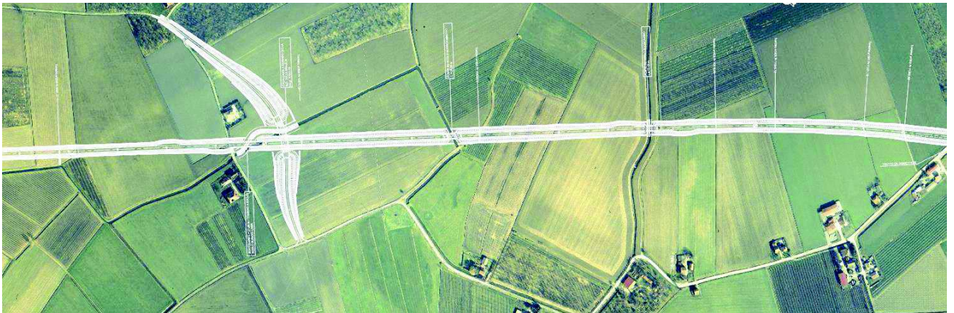
Ortofoto con sovrapposizione progetto - TRATTO 3