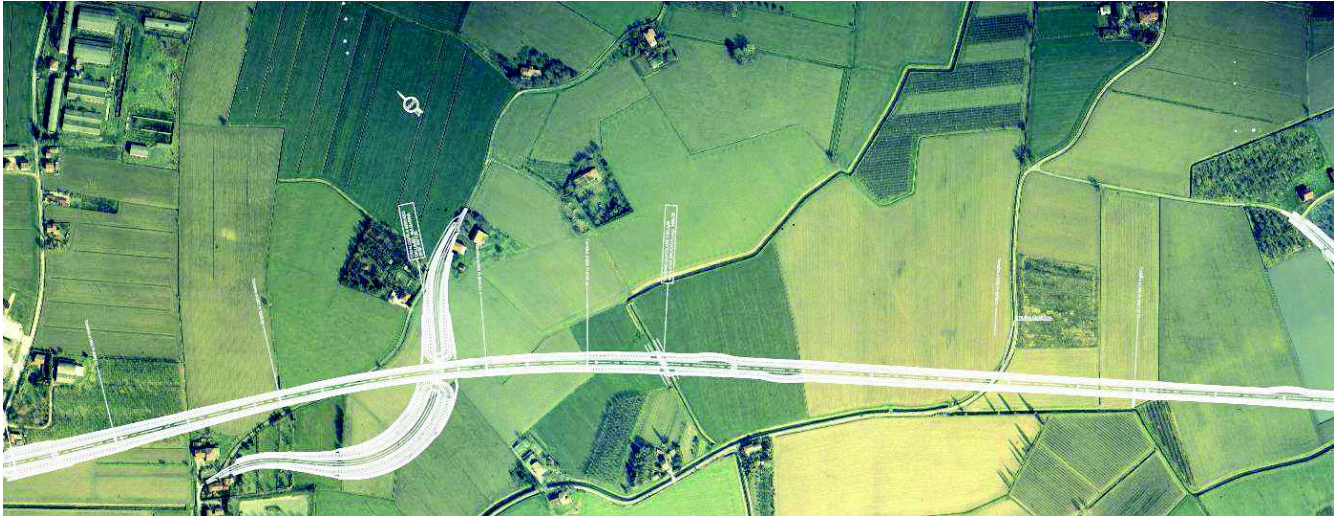
Ortofoto con sovrapposizione progetto - TRATTO 2