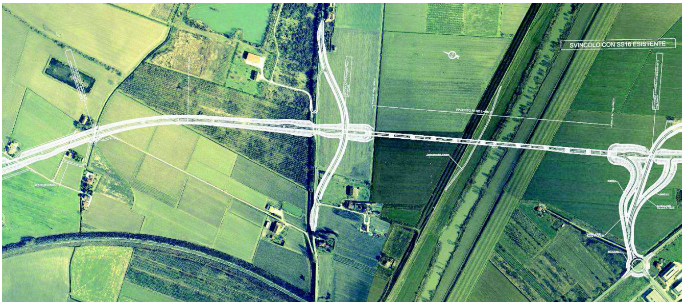
Ortofoto con sovrapposizione progetto - TRATTO 5