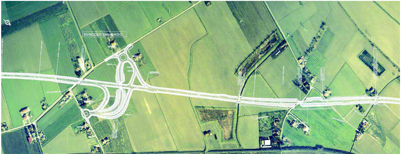
Ortofoto con sovrapposizione progetto - TRATTO 4