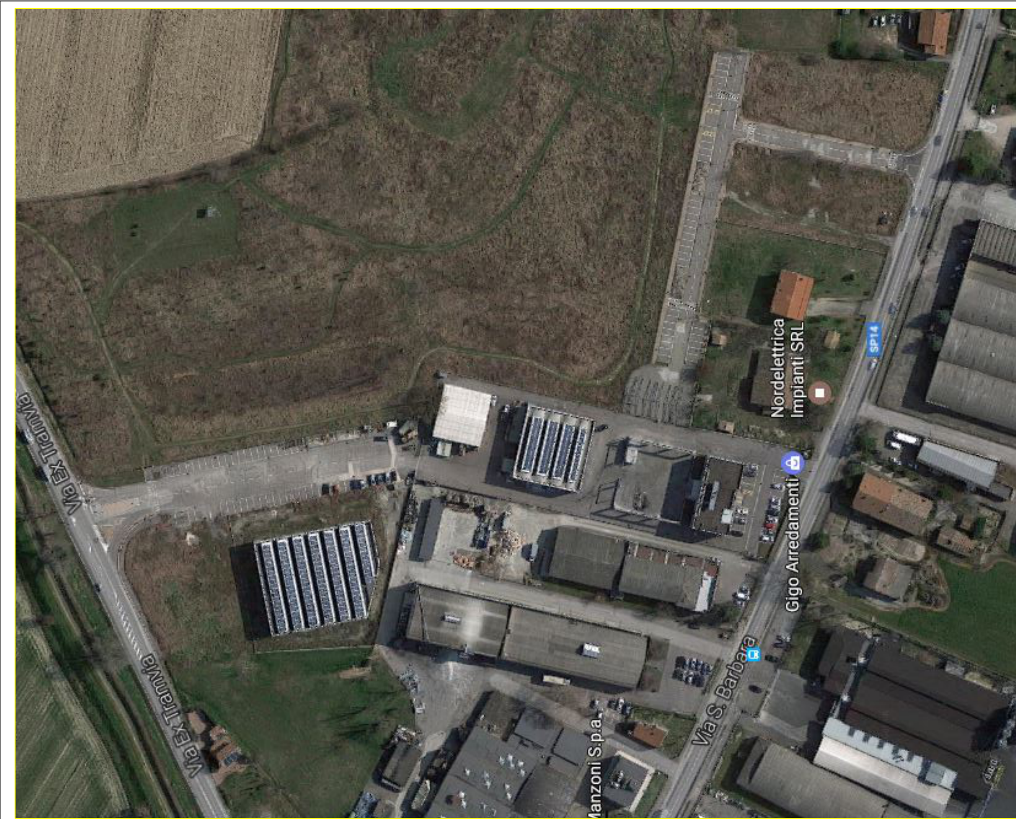
VISTA AERE A LOTTIZZAZIONE