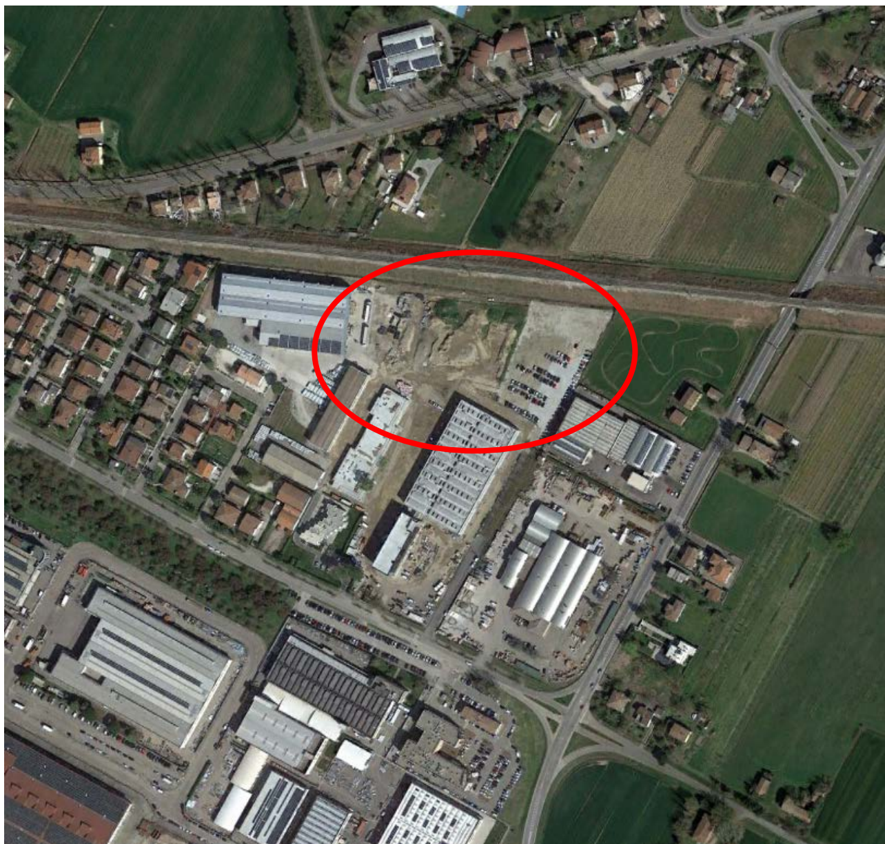
Figura 1 Inquadramento dell'area di intervento su base ortofoto

Di seguito si riporta una veduta su base fotografica aerea dell'area di intervento.